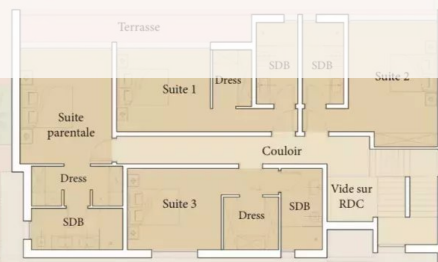
PLAN R + 1